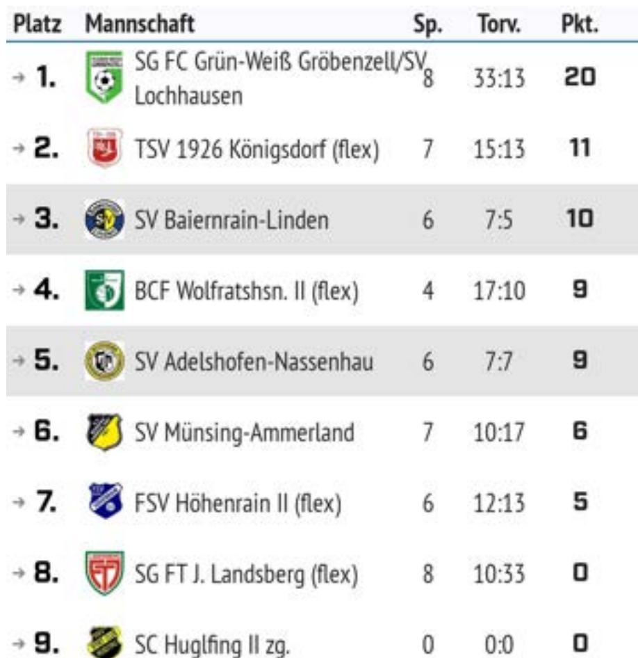
Tabelle Golden Girls