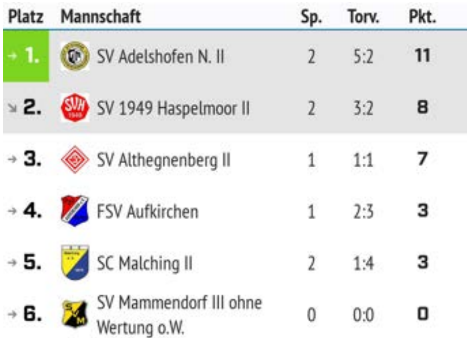
Tabelle „Zwoate“ Rückrunde 2022/23